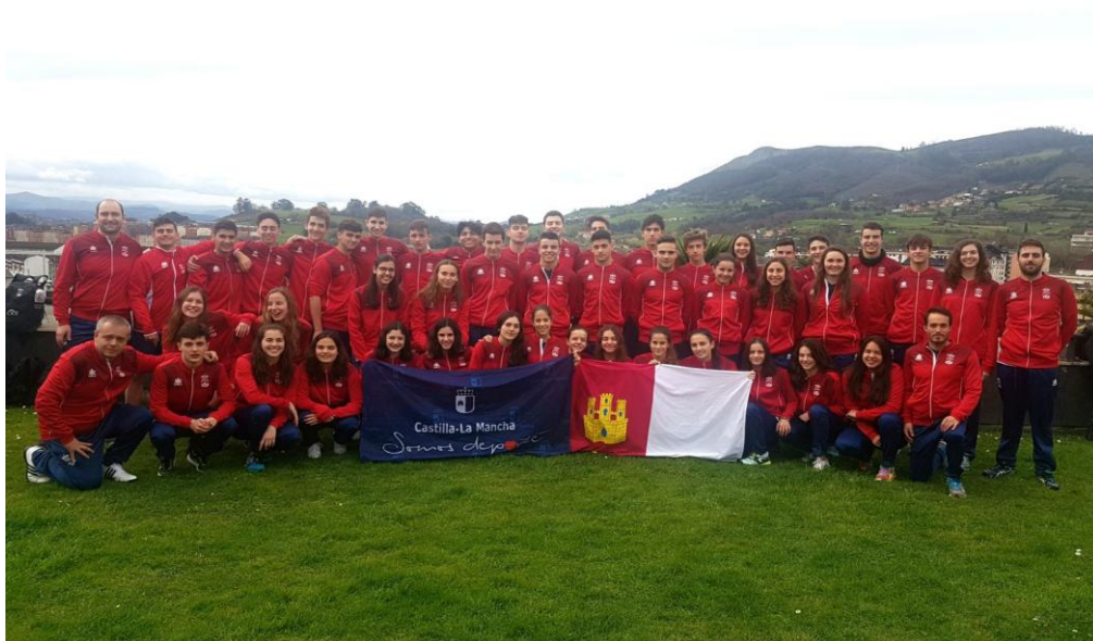
Dirección Técnica Federación de Natación de Castilla La Mancha